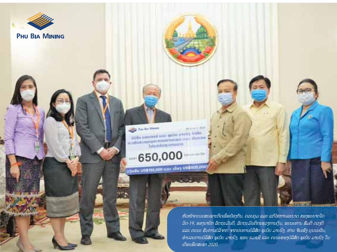
ຫົວໜ້າຄະນະສະເພາະກິດເພື່ອປ້ອງກັນ, ຄວບຄຸມ ແລະ ແກ້ໄຂການລະບາດ ຂອງພະຍາດໂຄວິດ-19, ຮອງນາຍົກ ລັດຖະມົນຕີ, ລັດຖະມົນຕີກະຊວງການເງິນ, ພະນະທ່ານ ສິມດີ ດວງດີ ແລະ ຄະນະ ຮັບການບໍລິຈາກ ຈາກປະທານບໍລິສັດ ພູເບ້ຍ ມາຍນິງ, ທ່ານ ຈິນຜົງ ບຸນນະຜົນ, ອຳນວຍການບໍລິສັດ ພູເບ້ຍ ມາຍນິງ, ຊອນ ແມ່ຊຸຊີ ແລະ ຄະນະຂອງບໍລິສັດ ພູເບ້ຍ ມາຍນິງ ໃນເດືອນພຶດສະພາ 2020.