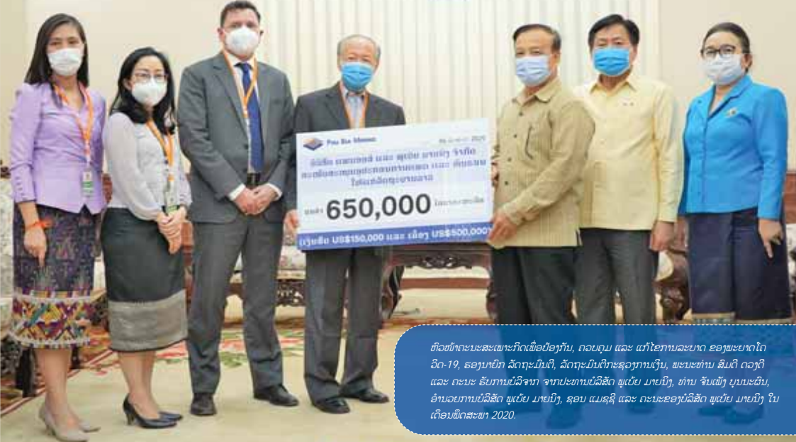
ຫົວໜ້າຄະນະສະເພາະກິດເພື່ອປ້ອງກັນ, ຄວບຄຸມ ແລະ ແກ້ໄຂການລະບາດ ຂອງພະຍາດໂຄວິດ-19, ຮອງນາຍົກ ລັດຖະມົນຕີ, ລັດຖະມົນຕີກະຊວງການເງິນ, ພະນະທ່ານ ສິມດີ ດວງດີ ແລະ ຄະນະ ຮັບການບໍລິຈາກ ຈາກປະທານບໍລິສັດ ພູເບ້ຍ ມາຍນິງ, ທ່ານ ຈິນຜົງ ບຸນນະຜົນ, ອຳນວຍການບໍລິສັດ ພູເບ້ຍ ມາຍນິງ, ຊອນ ແມ່ຊຸຊີ ແລະ ຄະນະຂອງບໍລິສັດ ພູເບ້ຍ ມາຍນິງ ໃນ ເດືອນພຶດສະພາ 2020.